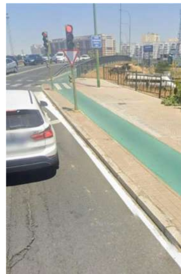
En las dos fotografías de la izquierda se aprecia el reducido acerado y en la de la derecha va paralela con el carril bici