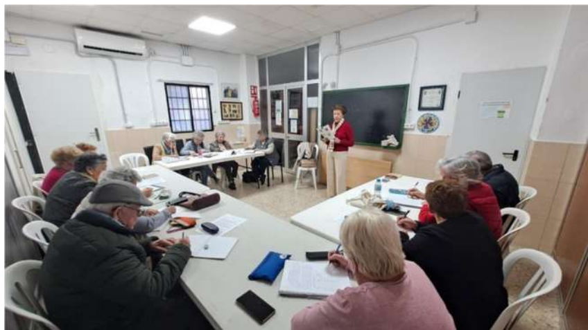
El nuevo taller de Memoria y Cultura General comenzó a funcionar