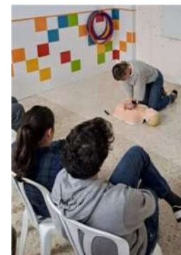
Momentos de la formación sobre los primeros auxilios