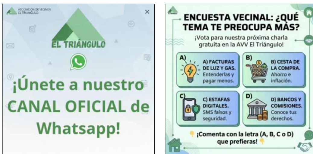
Cartel digital de nuestro canal y una de la primeras actividades realizadas

La Asociación de Vecinos ha puesto en marcha un nuevo canal oficial de WhatsApp, con la finalidad de fomentar el aumento del nivel de información a los/as asociados/as y vecinos/as que se quieran unir gratuitamente a dicho canal, por el que se estará enviado información de nuestras actividades y denuncias.