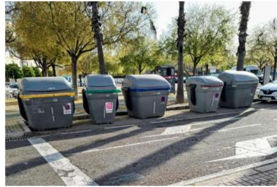
Los nuevos contenedores colocados en San José Obrero