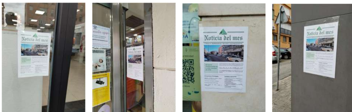
Carteles de la Asociación en paredes y locales comerciales

Consideramos que la celebración de esta reunión es muy necesaria, y si el Ayuntamiento desea que la reunión se realice en el local de la Asociación de Vecinos para nosotros será un placer ofrecer nuestro local para dicho fin y si por el contrario se estima que la reunión se deba dar en dependencias municipales nos parecerá también bien.