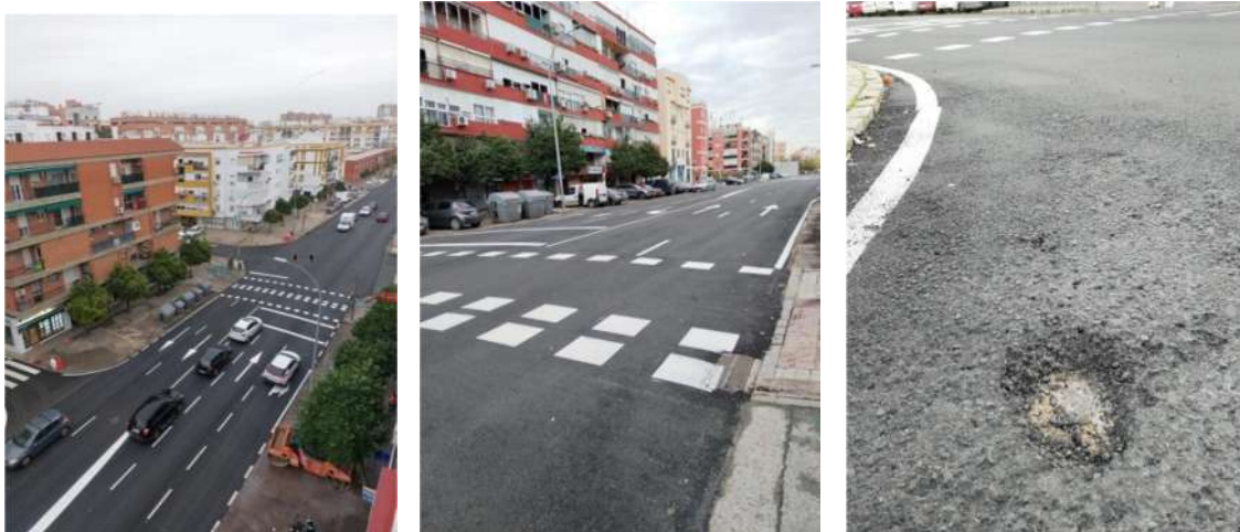
La calle Arroyo quedo pavimentada aunque comienzan a aparecer los baches

Lamentablemente han comenzado a aparecer las deficiencias y los baches en dichas calles a la altura del cruce con Francisco de Ariño.