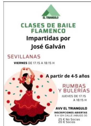
Cartel de la Clase Guitarra y la clase de guitarra y cartel de Baile Flamenco