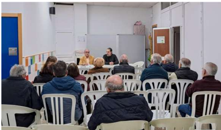
Cartel convocando la asamblea y asistencia de vecinos a la misma

Aunque no hemos tenido ninguna respuesta, hemos procedido a convocar una reunión o asamblea de vecinos, para informar de la relación de actuaciones que EMASESA y el Ayuntamiento, realizarán durante la remodelación de la calle y que serán las siguientes: