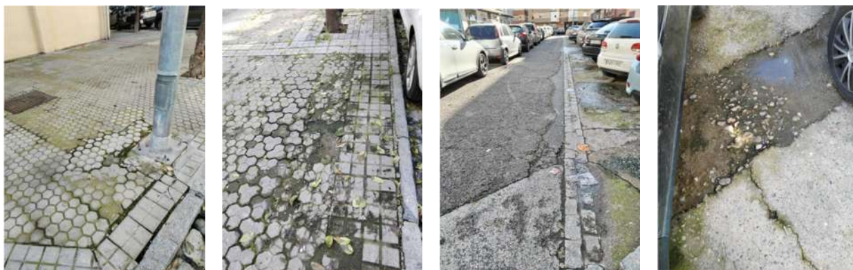
Desperfectos en el acerado y asfaltado de las calles Venecia y San Joaquín

para que solicitemos al Ayuntamiento la solución de los problemas existentes en las citadas calles y en otras colindantes, en relación a las graves deficiencias en el acerado y la pavimentación de las calles indicadas, tal como las mostramos en las fotografías que se adjuntan.