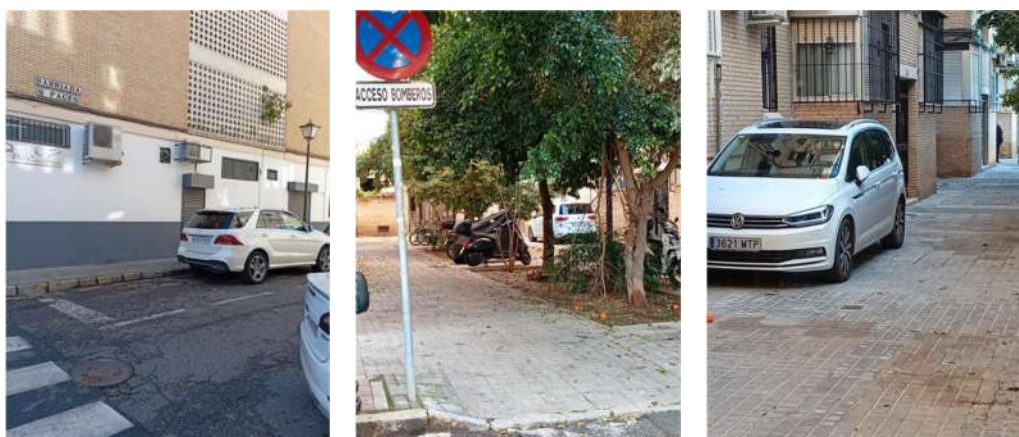
Farola donde estaba la señal de prohibido aparcar, el acceso restringido a los bomberos y ambulancias y coche aparcado en el acerado denunciado por los vecinos

A la entrada a la urbanización de San Pagés, desde la calle Samaniego en la acera de la izquierda, según se circula para dentro de la plazoleta, hay una farola que anteriormente portaba una placa de prohibición de aparcar. En esta vía existen dos carriles uno de entrada y otro de salida, así como una zona de aparcamiento en batería en el lado derecho, a la entrada de la urbanización y actualmente después del cambio de la mencionada farola, por deterioro, no se ha vuelto a colocar la placa de prohibición y aunque el bordillo del acerado está pintado de amarillo, desde hace algún tiempo se está aparcando en el carril de salida, no respetando la prohibición y dando lugar a que dificulten el tránsito de entrada y salida por la mencionada zona.