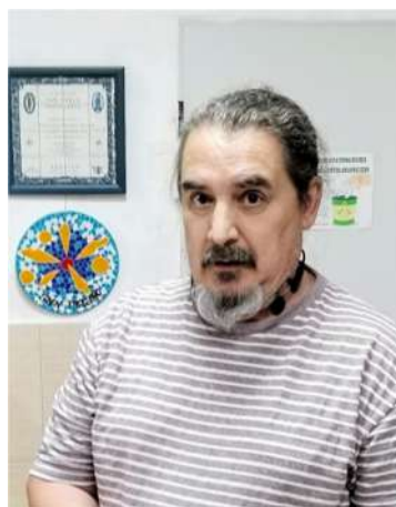
Director del Distrito San Pablo-Santa Justa y nuestro presidente

En relación a la petición de Arbolado en Francisco de Ariño, ha tenido una primera respuesta del servicio de parques y jardines, en la que nos indican que se ha pedido un informe técnico, pero que necesita ser revisada ya que denomina de forma errónea a la calle donde se pide la actuación y sobre la petición de los vecinos de Samaniego 12, tras la detección de una colonia de abejas en dicha finca, nos comentaron que se había pedido la actuación para solucionar el problema y que se iba a hacer seguimiento del tema.